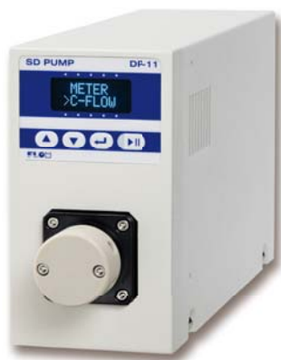
Switching Delivery Pump DP-11